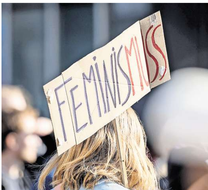
Ein Teilnehmerin einer Demonstration zum Weltfrauentag trägt ein Schild mit der Aufschrift „Feminis-muss“.

Ein Pkw-Fahrer, der seinen Wagen vor einem Lokal für kurze Zeit abgestellt hatte, um dort Ware abzuliefern, stellte bei seiner Rückkehr nach fünf Minuten fest, daß der Wagen fort war. Später wurde der Pkw im Straßengraben liegend gefunden.